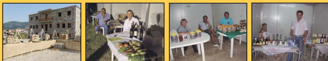
Στιγμιότυπα από προηγούμενες Εκθέσεις Αγροτικών, Κτηνοτροφικών Προϊόντων και Λαϊκής Τέχνης

Γενική Επιμέλεια Έκθεσης : Δρ Κώστας Σαχινίδης